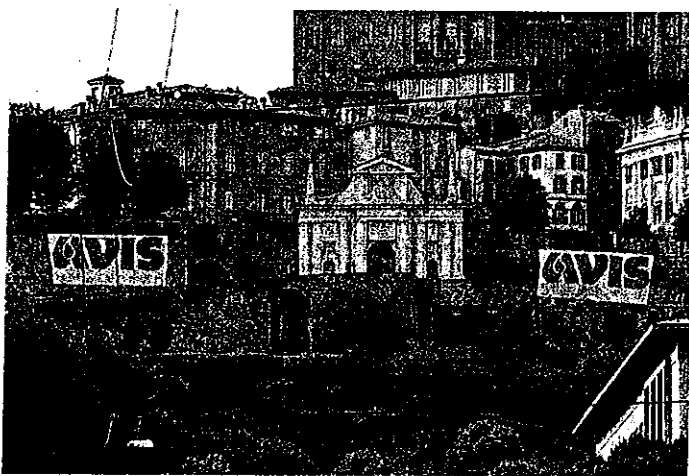
Gli striscioni dell'Avis sulle Mura in occasione dell'assemblea

«Il mare della bontà è fatto di mille gocce di sangue».