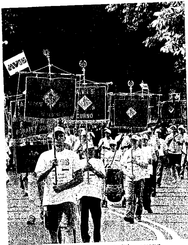
Centinaia di gagliardetti Avis per le vie della città