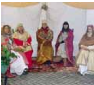
Il presepe vivente dell'anno scorso

A partire dalle 15, nei portoni delle case, dentro ai cortili e lungo le strade, andranno via via animandosi numerose scene che riprodurranno in parte il villaggio di Betlemme ai tempi della nascita di Gesù, in parte antichi mestieri e usanze in omaggio al mondo rurale: dal fabbro al falegname, dal ciabattino alle lanaie, dalla casa contadina ai vasai. Minuziosa, in tutti i casi, la cura dell'oggettistica e dei costumi, tutti fatti in casa sotto la supervisione delle